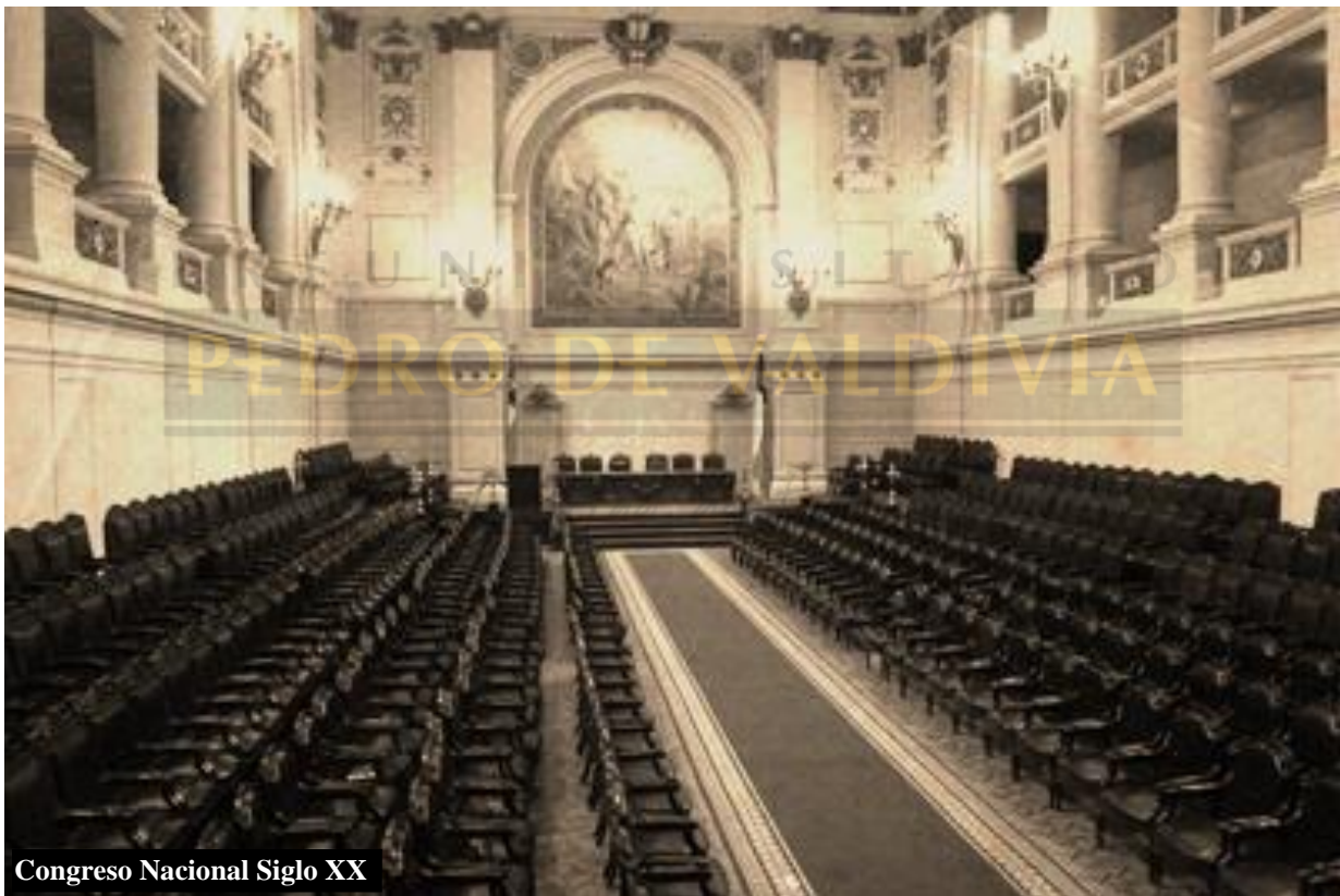
Congreso Nacional Siglo XX