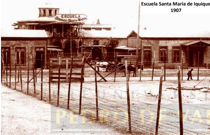
Escuela Santa María de Iquique 1907

El movimiento más grave se produjo en el gobierno de Pedro Montt. Fue la huelga que culminó trágicamente en la Escuela Santa María de Iquique en diciembre de 1907 . Participaron unos 10.000 trabajadores. Se originó por la solicitud de un aumento de jornales, argumentando que ellos no les alcanzaban para comer; se agregaban a lo anterior otras demandas como, el comercio libre para evitar abuso de las pulperías, medidas de seguridad en el trabajo, etc; todo lo cual fue rechazado de plano por los patrones. Los obreros con sus familias bajaron a Iquique exigiendo ser trasladados al sur. Fueron alojados en la Escuela "Santa María". Las conversaciones con el Intendente fracasaron. Éste ordenó desalojar la escuela. Los obreros se negaron. El General Silva Renard ordenó disparar. Hubo unos 2.000 muertos y otros tantos heridos. La censura impidió que los hechos se conocieran en ese tiempo en su real magnitud y sólo se tuvo una versión oficial de ellos en 1913 cuando una comisión, tardíamente designada, rindió un informe en la Cámara de Diputados.