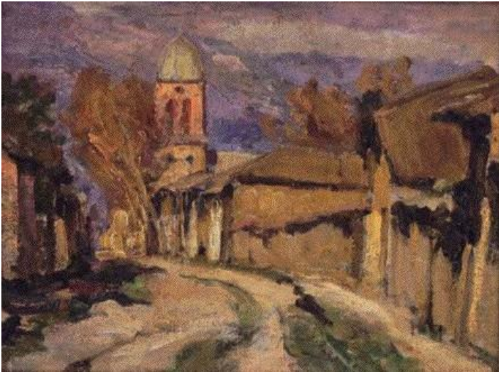
Callejón de San Fernando.